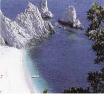
La spiaggia delle Due Sorelle