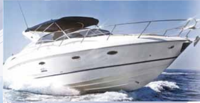
Cruiser in planata