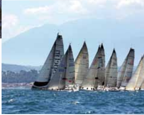
Campionati Mondiali ORC